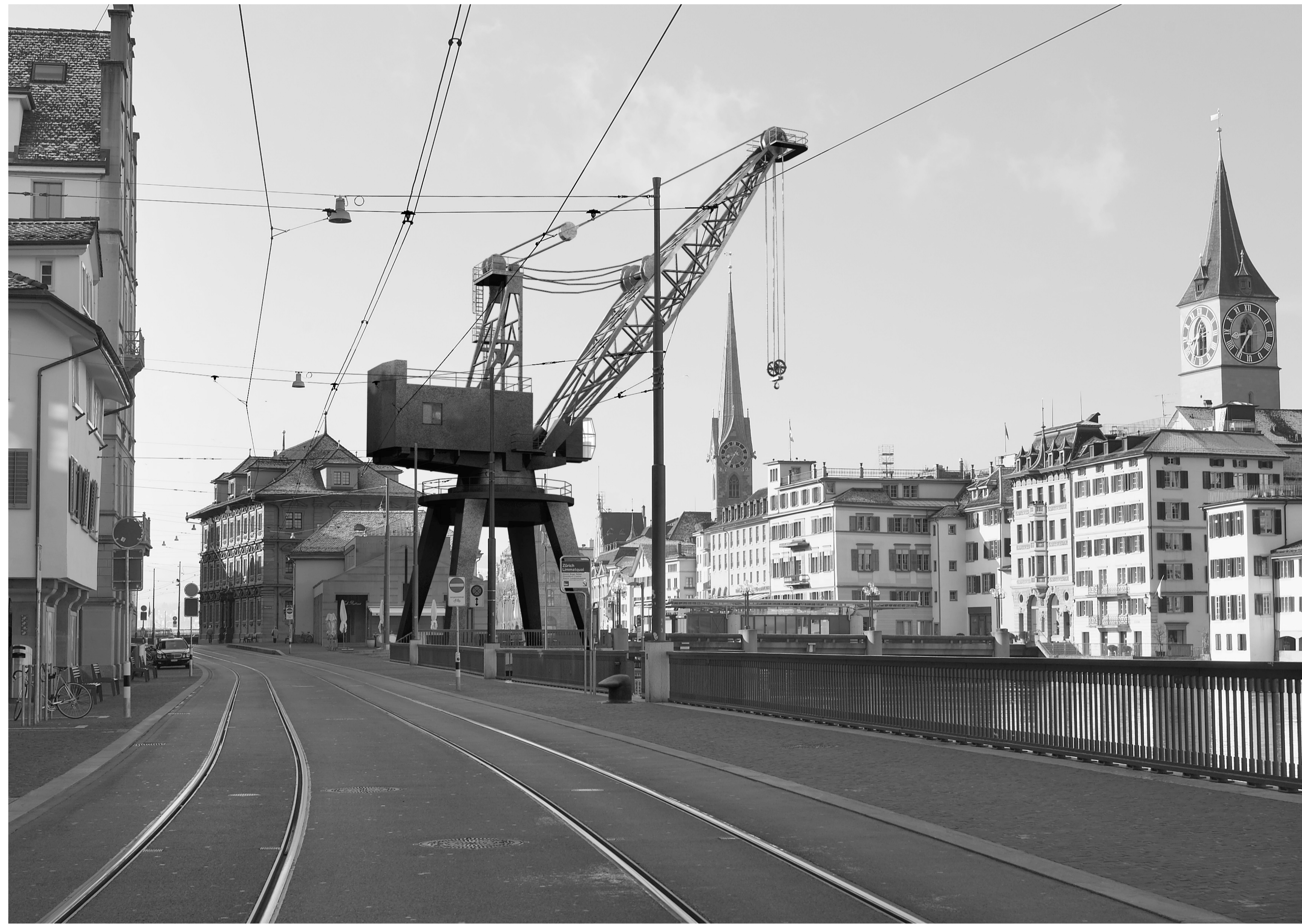
Hafenpoller und Kran prägen 2011 die städtischen Quaianlagen.