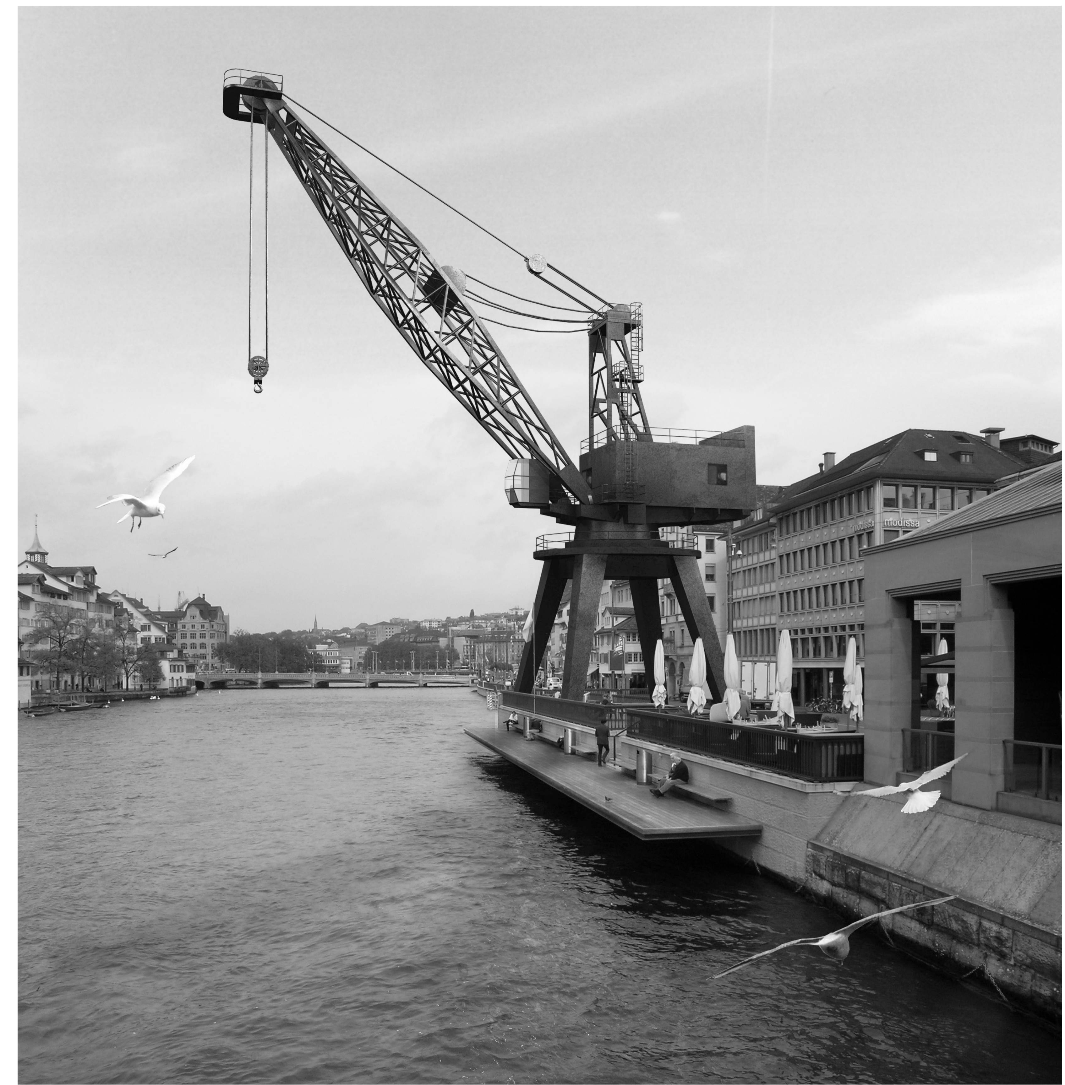
Am Richtfest des freigelegten Krans durchdringen erstmals die langgezogenen, tiefen Töne eines Schiff-Signalhorns die Gassen der Altstadt.