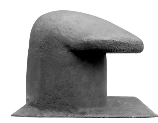
1 Ansicht Hafenpoller B 70 cm, T 70 cm, H 55 cm