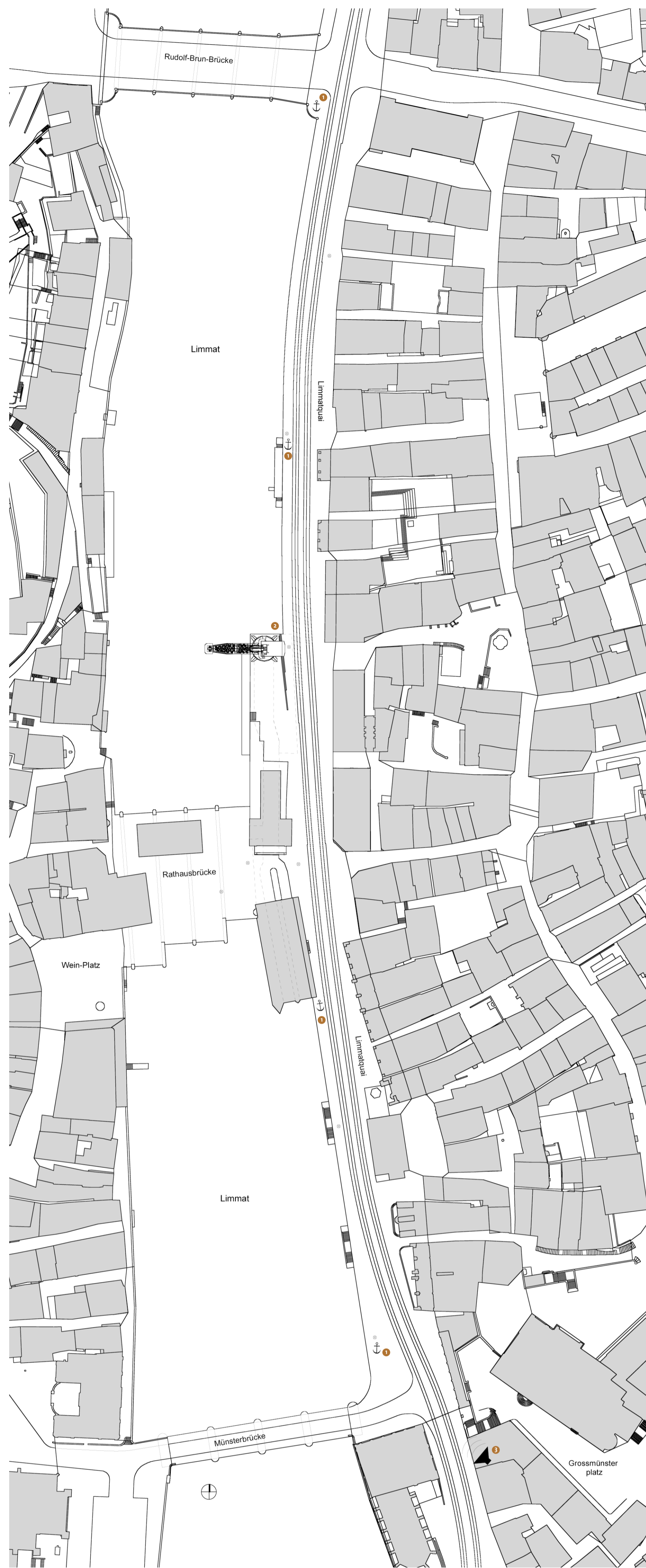
Lageplan Massstab 1:1000